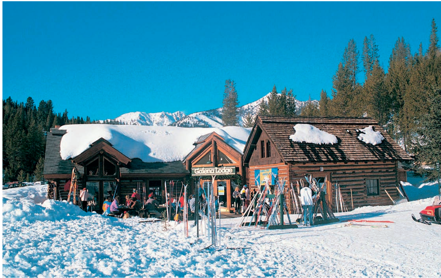
Einkehrschwung in eine der einladenden Lodges.

Wer dutzende von Westernfilmen auf dem Rücken eines Pferdes souverän bestritten hat, der lässt sich auch von einem Skilift nicht so leicht abwerfen. Etwas angespannt wirkt er schon, Hollywoods berühmtester Cowboy John Wayne, wie er sich da an den Bügel des Schlepplifts klammert. Aber auf der Piste soll „The Duke“ eine umso bessere Figur gemacht haben.