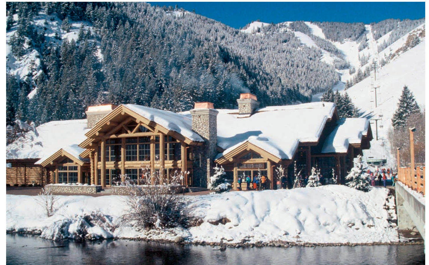
Mondän und gleichzeitig rustikal präsentieren sich die Lodges im US-Mountain-Style.

Edel, rustikal und geräumig sind die Lodges an den Talstationen und auf dem Berg. Restaurant, Bar, Umkleideräume, Ticket-schalter – alles unter einem Dach – und eine schöner als die andere, ob die River Run Day Lodge, die Warm Springs Day