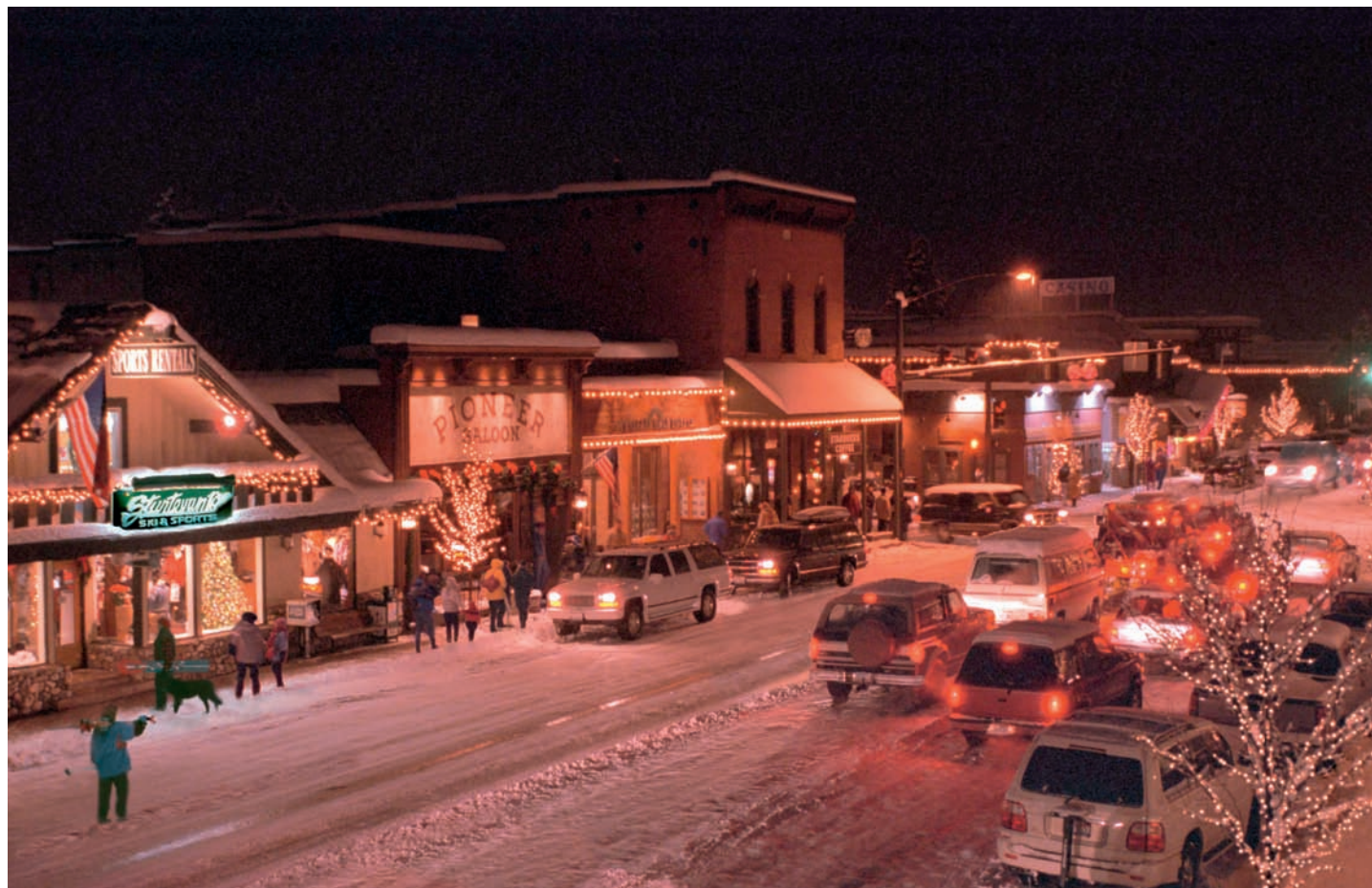
Wie sich Europäer Amerika vorstellen: Winterlicher Glitzer im kleinen Städtchen Ketchum, dem zauberhaften Zentrum der Region, das schon Ernest Hemingway faszinierte.