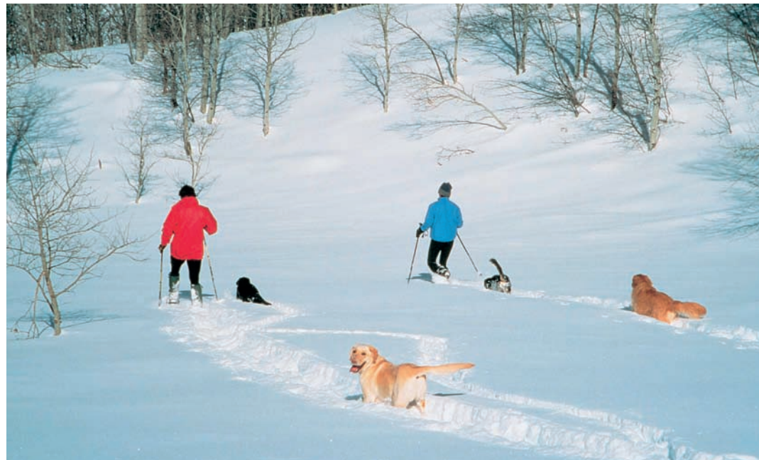
Wintersport für Mensch und Hund, fern von Pistenrummel und Leinenzwang.

Wer glaubt, das mondäne Aspen in Colorado sei das weiße Mekka der Schönen, Reichen und Berühmten, der hat Sun Valley noch nicht kennen gelernt. Das älteste Skiresort Amerikas (1936 gegründet) war und ist das ultimative Shangri-la der schneeverliebten Society. Spätestens seit dem bahnbrechenden Erfolg des Ski-Eislauf-Musik-Liebesfilms „Sun Valley Serenade“ aus dem Jahr 1941 – bei uns ein Kassenschlager unter dem Titel „Das adoptierte Glück“ – klingt der Name des